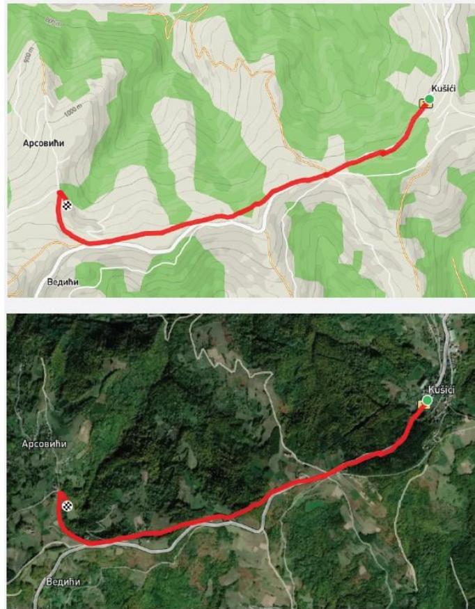
Приказ руте на мапи и сателитски снимак руте центар Кушића – кућа Јакова Туманског

Обележавање ове пешачко бицикличке стазе - процењена вредност обележавања је око 400.000,00 динара и финансирана би била са конта 511200 и програмске активности 0001.