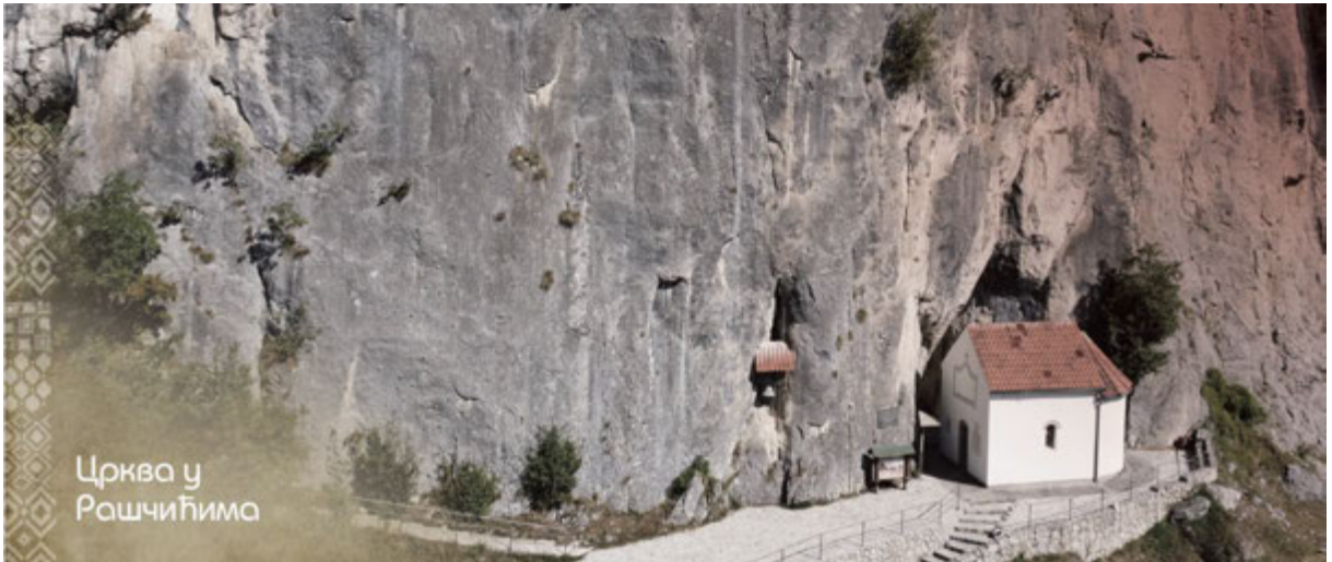
Црква у Рашчићима