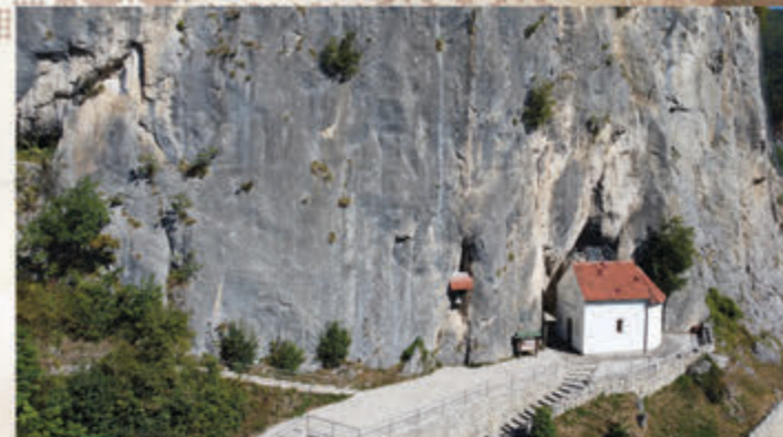
Хаџи-Проданова пећина / Hadži-Prodanova's cave 📍 Рашчићи / Raščići

Information: tel: +381 32 665 085, 650 290, e-mail: office@ivatourism.org