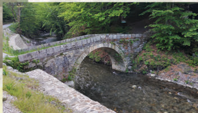
Римски мост / Roman bridge 📍 Куманица / Kumanica