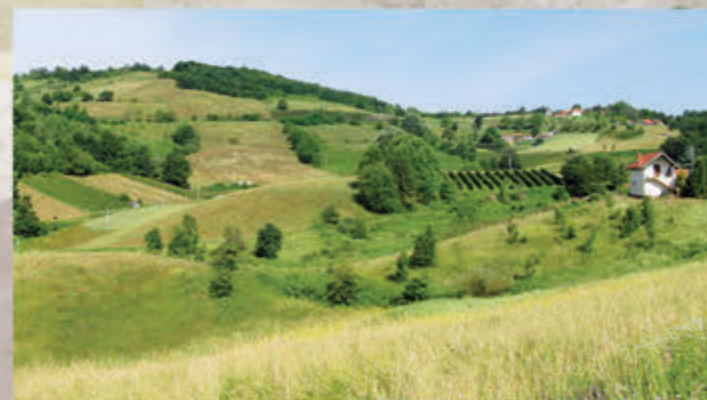
Поља у Лиси / Fields in Lisa 📍 Лиса / Lisa