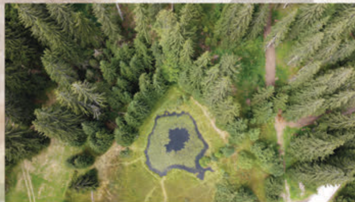
Даићко језеро / Daići Lake 📍 Даићи / Daići

Information: tel: +381 32 665 085, 650 290, e-mail: office@ivatourism.org