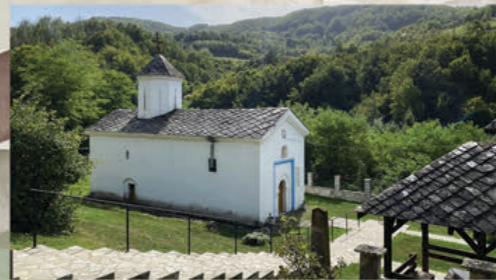
Бела црква / Bela church 📍 Катићи / Katići