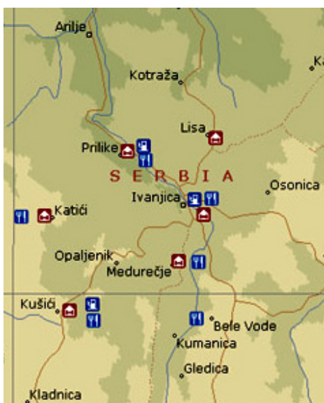
Slika 1 - Turistička karta Ivanjice

Na teritoriji opštine Ivanjica (slika 1) ima sedam sela koja su osposobljena da prime turiste: Devići, Bele Vode i Medurečje na padinama Golije, Kušići na padinama Javora, Maće i Katići na padinama Mučnja i Lisa - selo na desetak kilometara od Ivanjice. Maće, Devići i Lisa prvi su počeli da primaju turiste. U njima je dakle začet seoski turizam u ovom planinskom kraju Srbije.